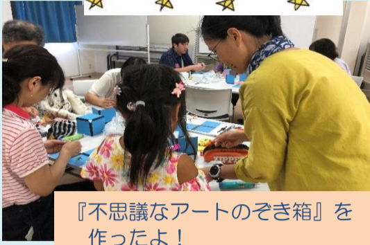
『不思議なアートのぞき箱』を作ったよ!