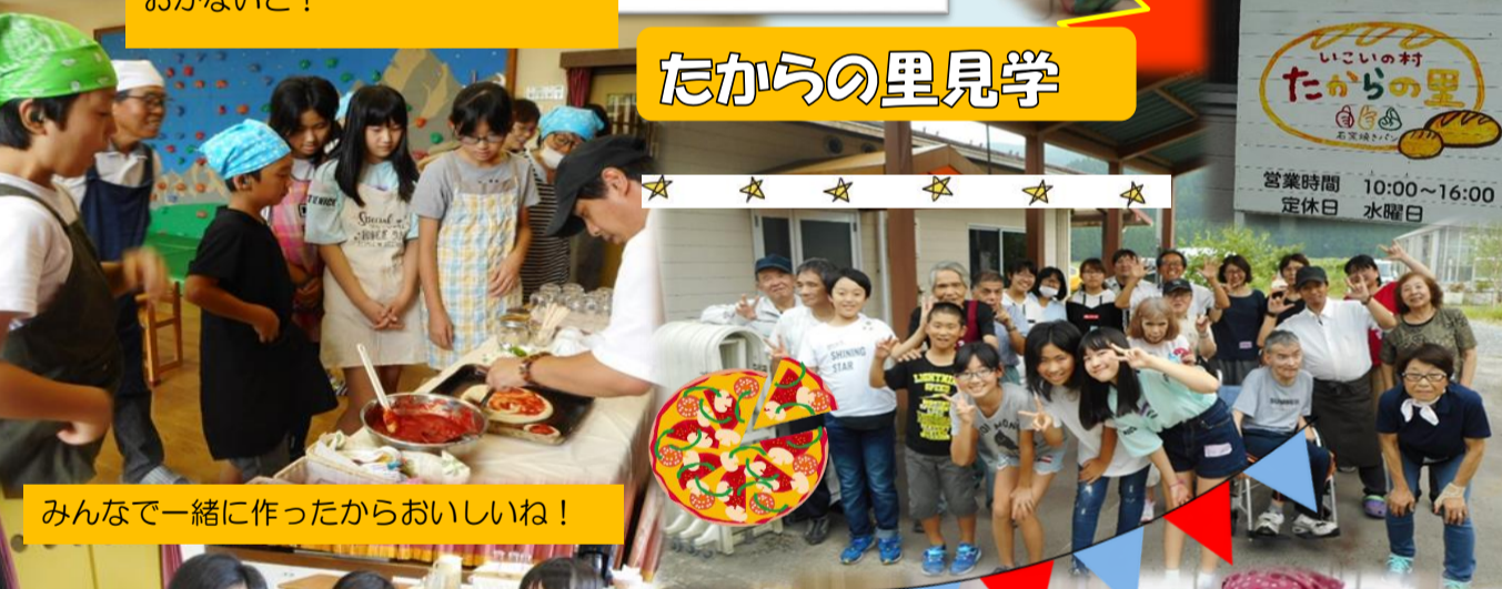
みんなで一緒に作ったからおいしいね！