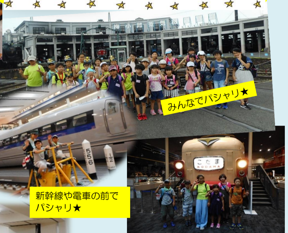
みんなでパシャリ★