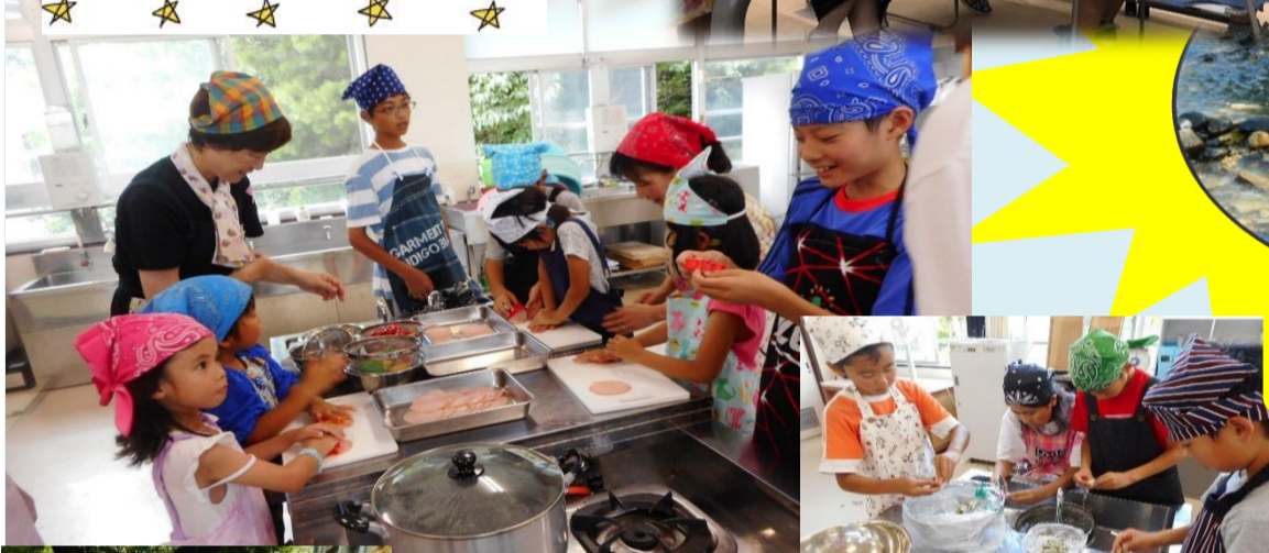
自分たちでそうめんの準備をしたよ!