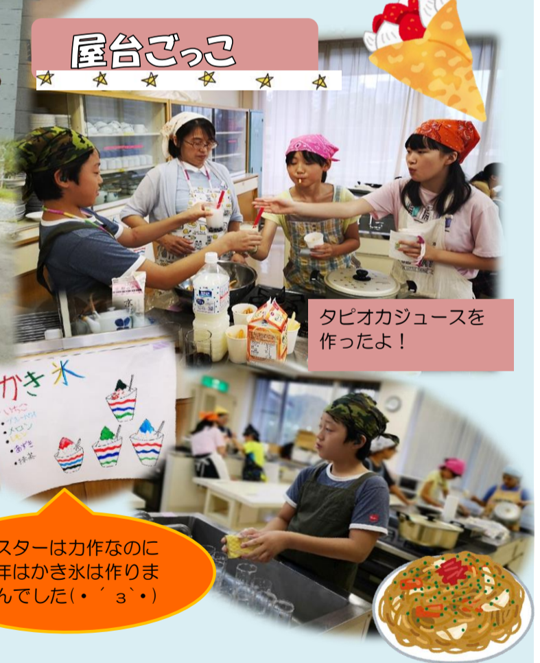
タピオカジュースを作ったよ！