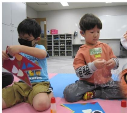
ちよっきん、ちよっきん