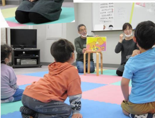
じょうずにおきがえできたね！

絵本ではなく、紙芝居を読んだよ！ 『じぶんで！』『かんぱ〜い！』の2つ。 くうちゃんは自分でお着替えをしたいけど…？ ちゃんとお着替えできたかな？ お祝いのときはかんぱ〜い！みんなで一緒にかんぱ〜いすると楽しいね。