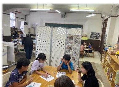
↑グループ対抗戦。知恵を出し合って問題を解きました。