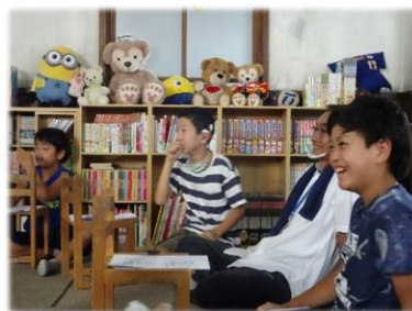
↑個人戦。スクリーンに表示される問題を解きました。

謎を解いた時の「分かった!」と、とてもスッキリした表情をしていたのが印象的でした。