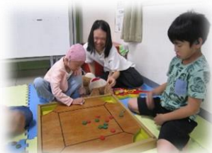
れんと君、初カロム!