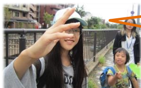
見て! きれいなしずく。