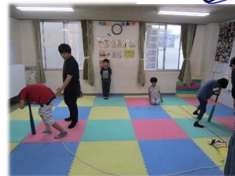
今、にじで人気のぐるぐるバット相撲。見ている方が気持ち悪くなります。