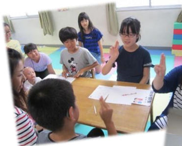
9/1(土) 手話指導の練習