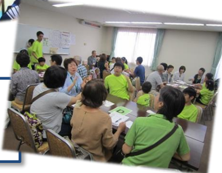
9/2(日) 手話まつり 当日