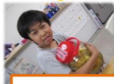
梅の瓶を振るお仕事