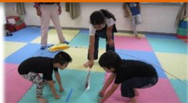
不定期開催大相撲にじ場所