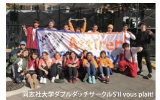
同志社大学ダブルダッチサークルS'il vous plait! 二本のロープを使ったアクロバティックなパフォーマンス 大会優勝経験有り