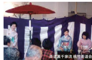
茶道裏千家流 桃竹茶道会

近畿ノウフクブース (府内ならびに近畿のノウフクに取り組む事業所) さんさんノウフクブース (さんさん山城の「ノウフク・ノンアレルギーカレー」 「えびいもコロッケ」、「採れたて野菜」等)、玉露そばブース (飯岡玉露そばクラブ) 農協ブース (JA京都やましろ京田辺支店直売所にこここ市)、地元特産品ブース (普賢寺ふれあいの駅、地元農家)