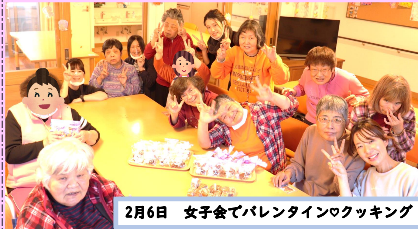
2月6日 女子会でバレンタイン♡クッキング