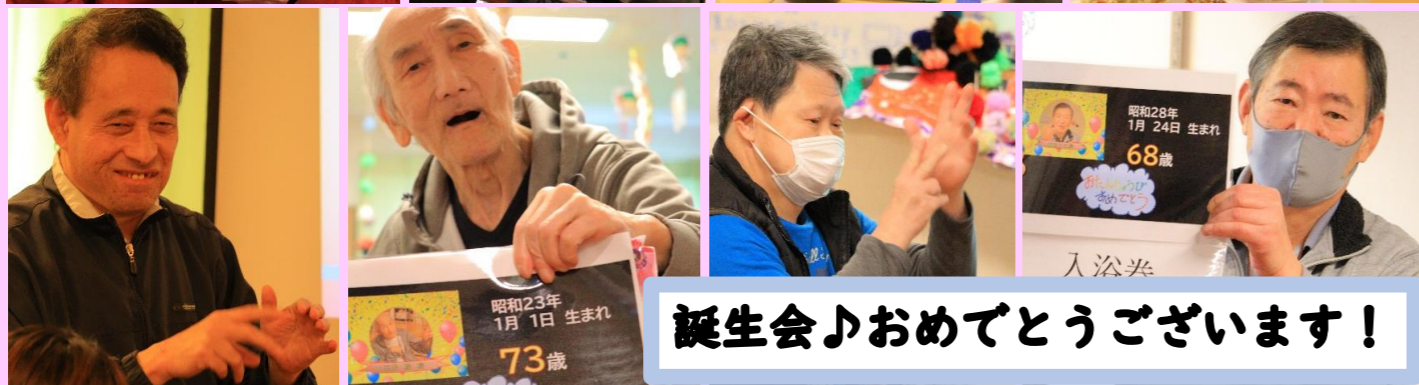
誕生会♪おめでとうございます！