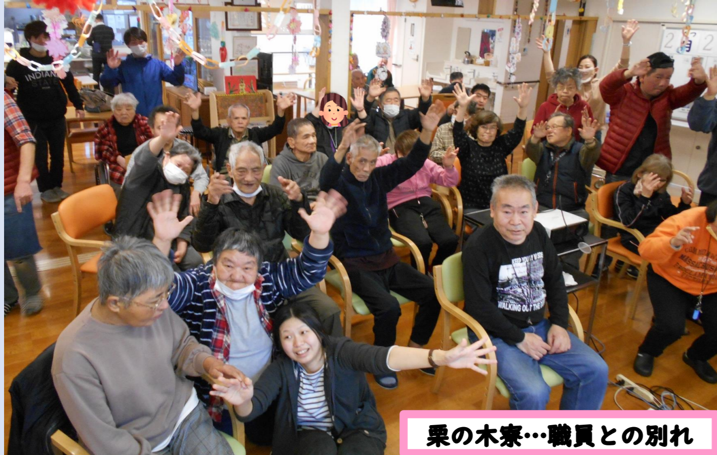
栗の木寮…職員との別れ

令和3年3月31日発行 TEL:0773-46-0102 FAX:0773-46-0903