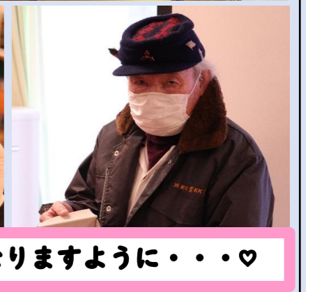
この一年が素敵な日々になりますように・・・♡