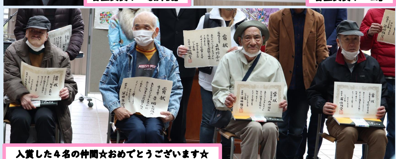
入賞した4名の仲間☆おめでとうございます☆

早いもので、3月も残り少し。令和2年度が終わろうとしています。春は、別れと出会いの季節でもあります。仲間のみなさんにとっても、色々な思いをされる時期でもあります。暖かくなったら、もう少し外に出かけて、多くの人と交流ができればと思います。