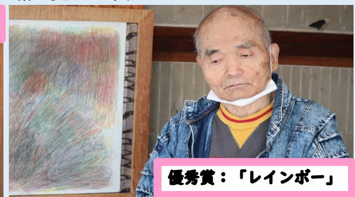
優秀賞: 「レインボー」