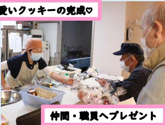
仲間・職員へプレゼント