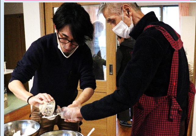
分量を量る・混ぜる・型抜きをする…

ラッピングされたクッキーは、女性陣へ届けられました。受けとった女性陣はニコニコ笑顔♪その表情を見た男性陣も『僕たちが作ったんだ』と誇らしげな表情を浮かべていました。