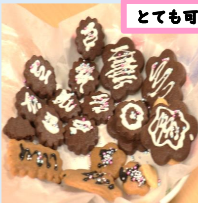
とても可愛いクッキーの完成♡