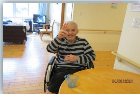
元気が一番ですよ〜!(^^)!