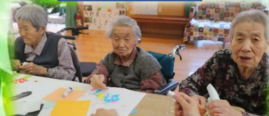
紙をちぎる方、糊付けする方役割分担して進行中。