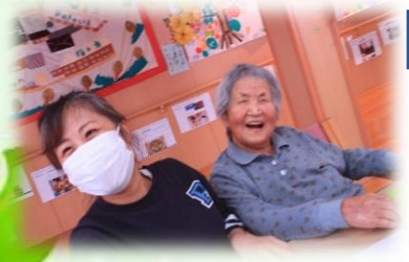
終わった後は、お菓子とコーヒーでほっこり。