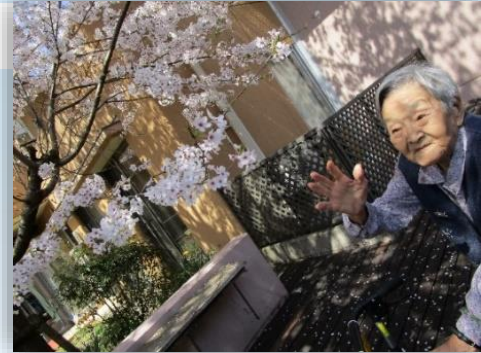
綺麗に咲いとるね〜♪