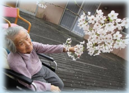
又1年、元気で過ごせます ように！！