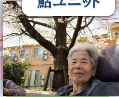
春の風が心地よいですね。