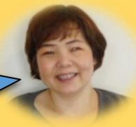
以前は梅の木寮の施設長もしていました。 久しぶりに戻ってまいりました。