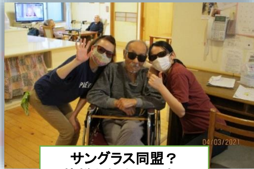
サングラス同盟？ 皆様お似合いです。