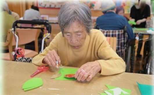
型紙を使って、葉っぱの縁取りを行います。