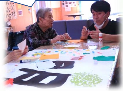
大きさこれで良いかい？