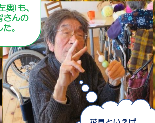
花見といえば お団子！ 美味しい！