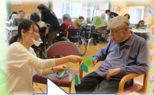
今から飾りますよ。