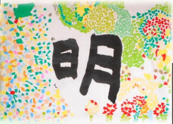
緑色の葉っぱ作りと、今年度の梅の木寮の漢字である「明」のちぎり絵を行いました。