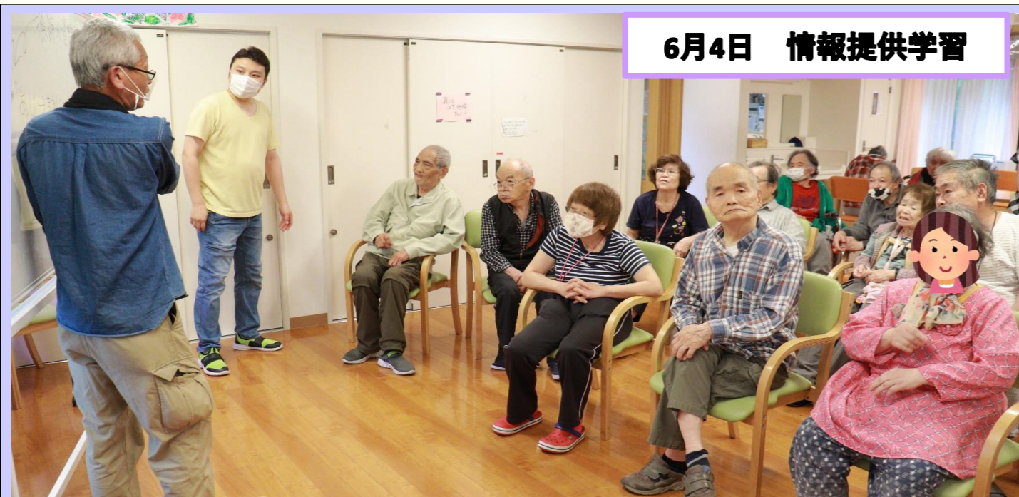
6月4日 情報提供学習