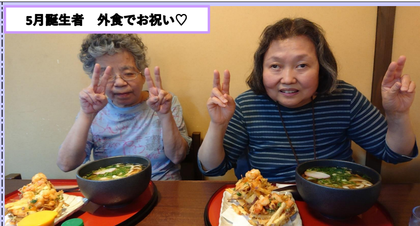
5月誕生者 外食でお祝い♡