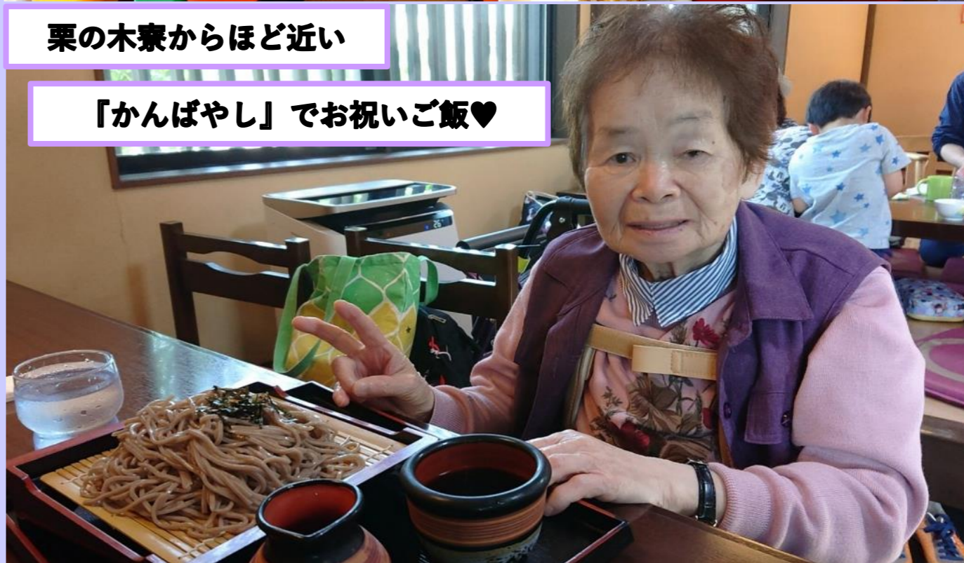
栗の木寮からほど近い