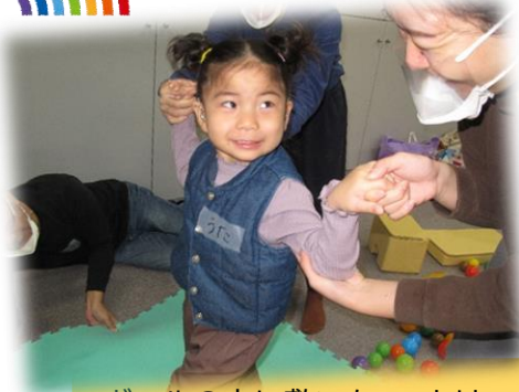
ボールの上に敷いたマットはスィ〜っと動いたね！