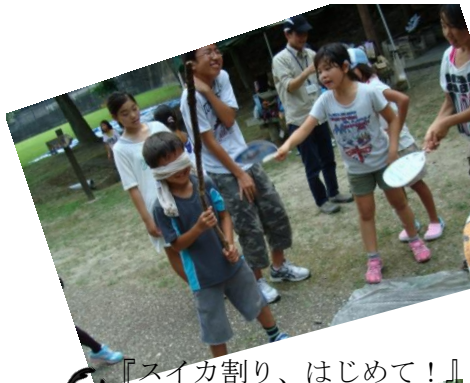
『スイカ割り、はじめて！』

聾学校の奥にある「ふれ あいの森」でバーベキュー をしました。山城と京 都市のデイサービス合同 企画です。「バーベキュー おいしかったあ！」「スイ カ割り初めて！！」