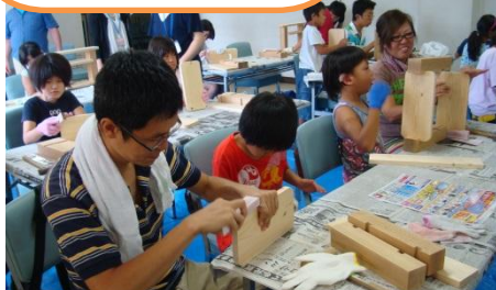
『親子で頑張った木工教室』