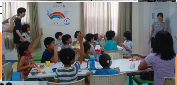
『全国手話研修センターも見 学に行ってきたよ』

夏休みには中学生や高校生の参加 もありました。 小学生には、頼れるお兄ちゃん の存在はやっぱりうれしいよう です。