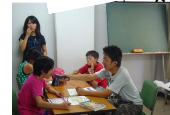
『いろいろな「はかる」をやってみた』