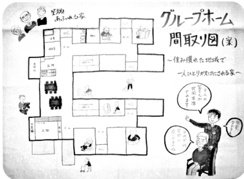
住み慣れた地域で一人ひとりが大切にされる家