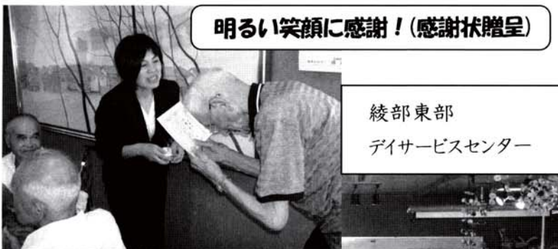
明るい笑顔に感謝！（感謝状贈呈）