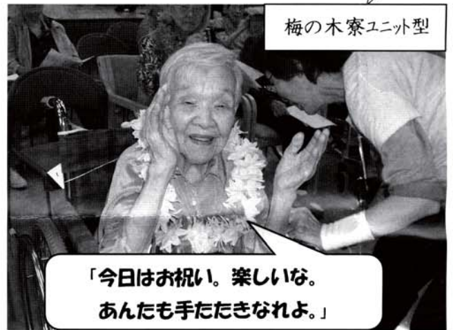
梅の木寮ユニット型