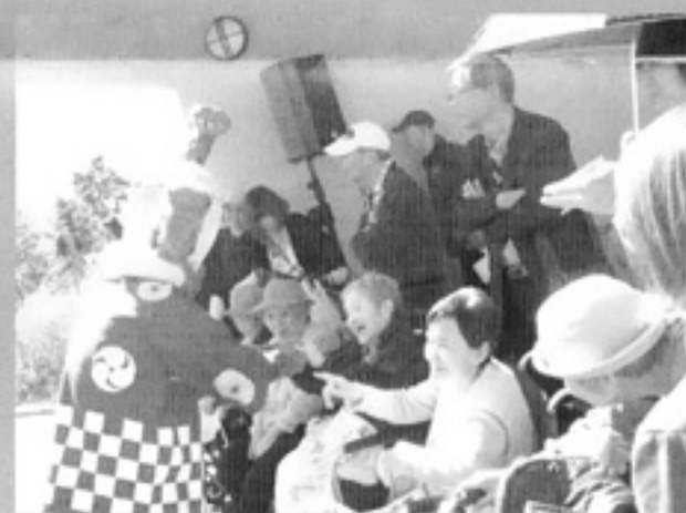
村ベエが利用者を笑顔にしてくれました