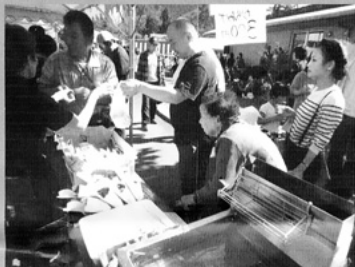
30店をこえる模擬店がありました