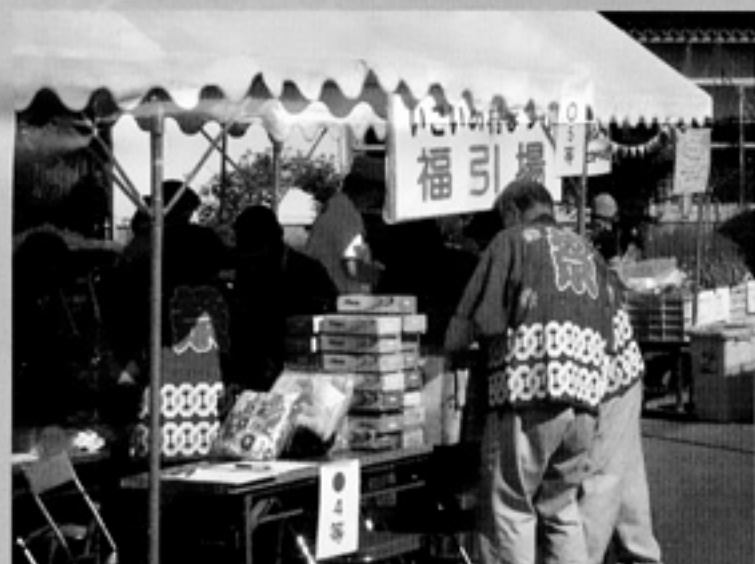
後援会口上林世話人会福引