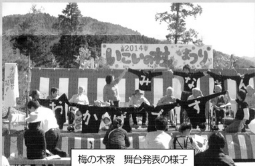
梅の木寮 舞台発表の様子