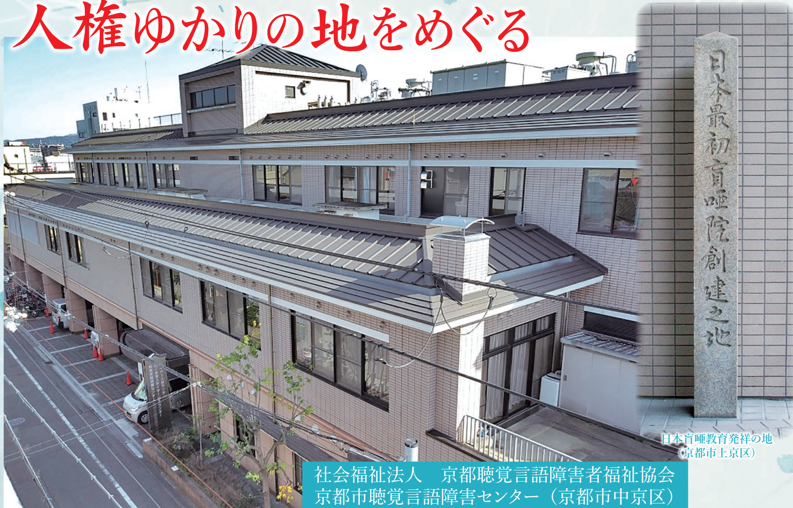
日本盲啞教育発祥の地 (京都市上京区)

社会福祉法人 京都聴覚言語障害者福祉協会 京都市聴覚言語障害センター (京都市中京区)