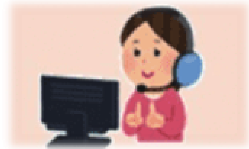
手話オペレーター