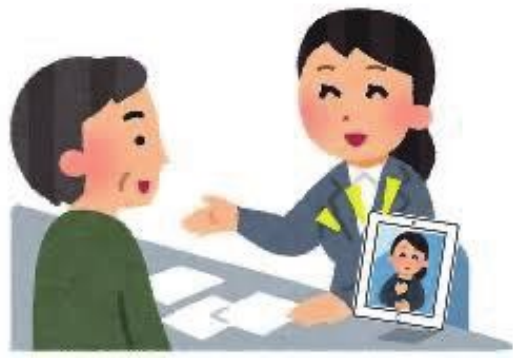
聴覚障害者の来客が あったとき