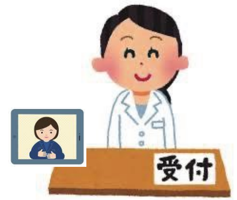
窓口に設置通訳者が いないとき