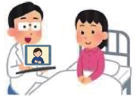
聴覚障害者が 入院したとき