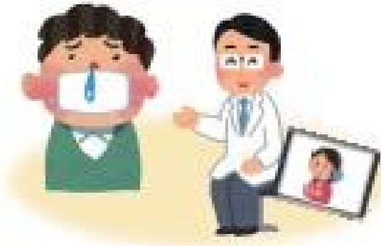
ウイルス感染症の疑いなどで 通訳者を呼べないとき