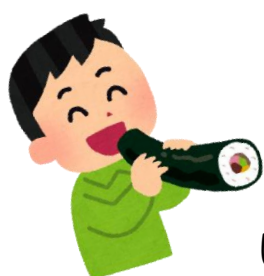
いつもより、とっても静かな昼食タイムでした、笑