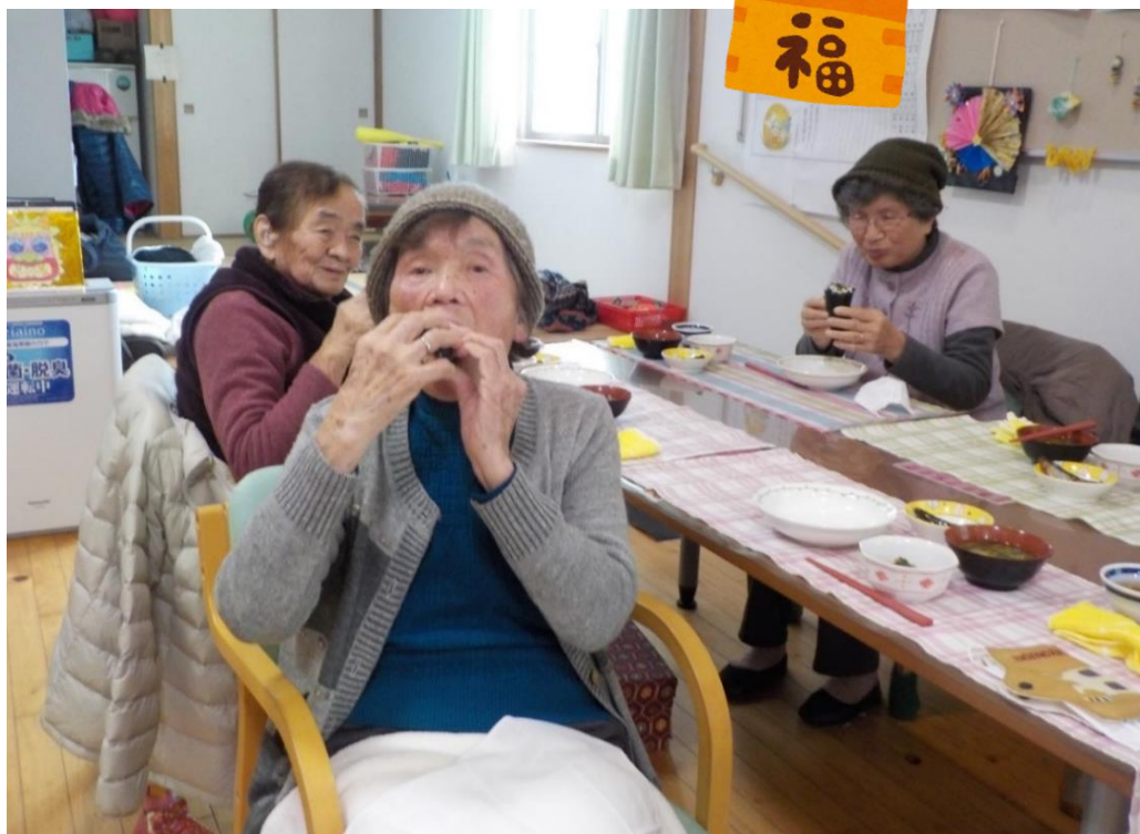
《患方を向いて黙って食べる》に挑戦中の皆さん