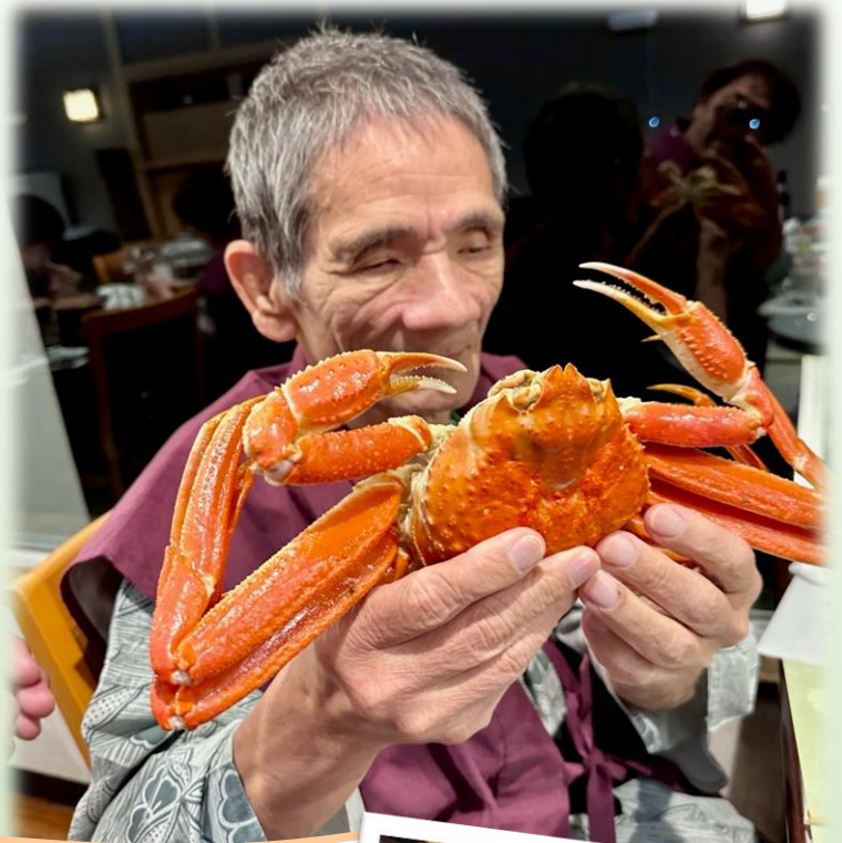
夜は贅沢♪豪華なカニ尽くし♡