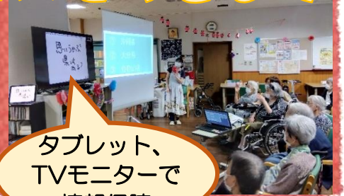
タブレット、 TVモニターで 情報保障

きこえの森では、皆さんに情報をお伝えする際に音声だけでなく、「手話通訳」「筆談」を用いたりタブレットやテレビモニターに文字や図を映し、その場にいる全員に情報が伝わるように工夫しています。