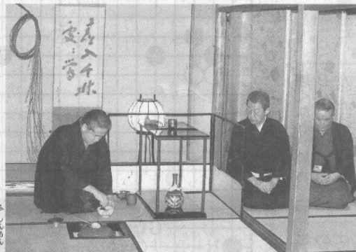
濃茶を練って招待客をもてなす表千家の千宗左家元＝上京区の不審菴