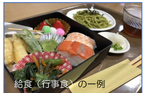
給食 (行事食) の一例