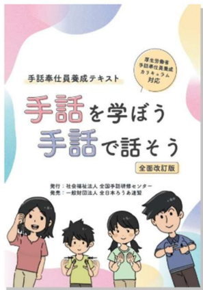
実技テキスト表紙